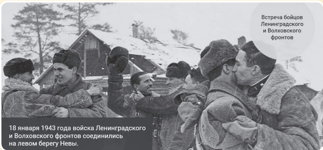
Встреча бойцов Ленинградского и Волховского фронтов

18 января 1943 года войска Ленинградского и Волховского фронтов соединились на левом берегу Невы.